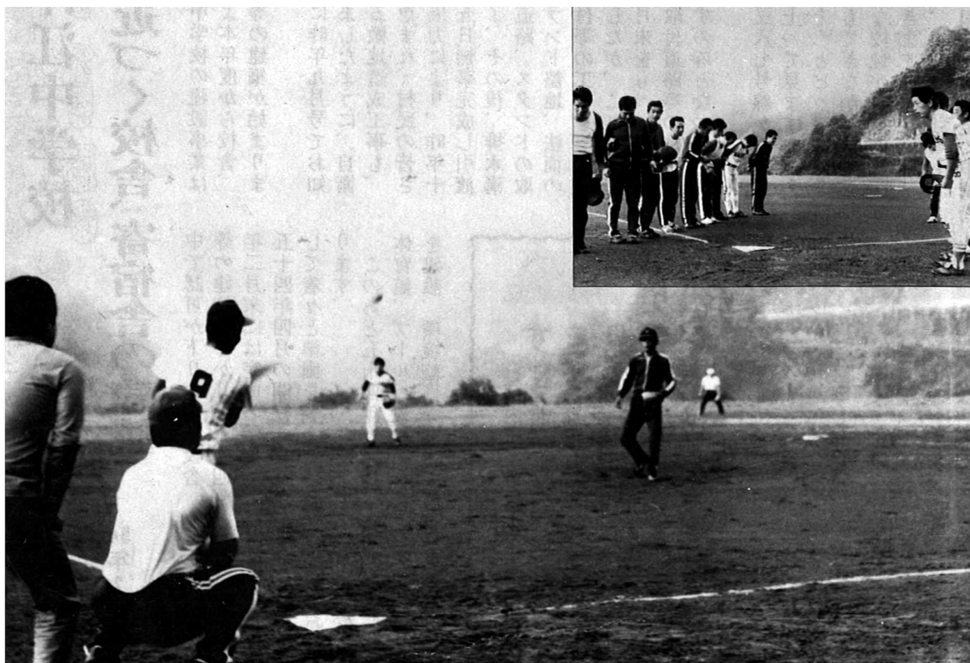
(第5回 早朝ソフトボール大会)