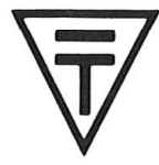
乙種電気用品の マーク