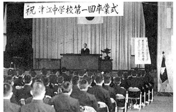
学校一名の予定です。

三月八日、去年四月に開校された津江中学校で第一回卒業式がおこなわれ、日ごろはしやきまわっていた五十八名の卒業生も、この日はかりはいつになく神妙な顔つきで卒業証書を受け取っていました。 卒業生もこれからは、進学、就職と新しい道を歩きはじめますが、津江中学校の第一回卒業生として後輩たちの手本となるようがんばってもらいたいものです。 なお、今年の入学予定者数は、津江中学校四十四名、川辺小学校九名、丸蔵小学校六名、鯛生小