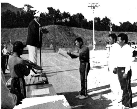
表彰をうける丸蔵支部代表

最後に村の限らない発 展を祈念するとともにみ な様方のご健康と一層の ご活躍を心からお祈りし まして、退職のあいさつ といたします。