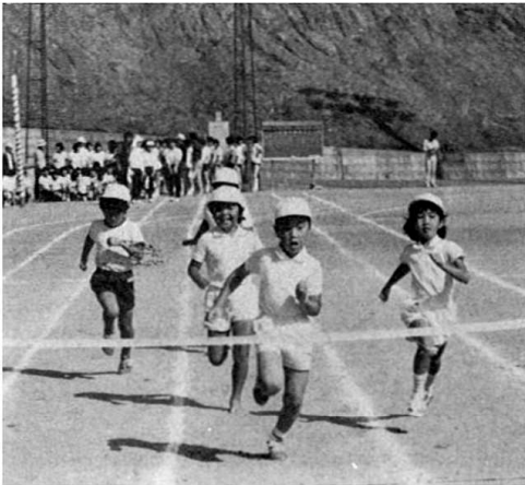
元気いっぱいのチビっ子