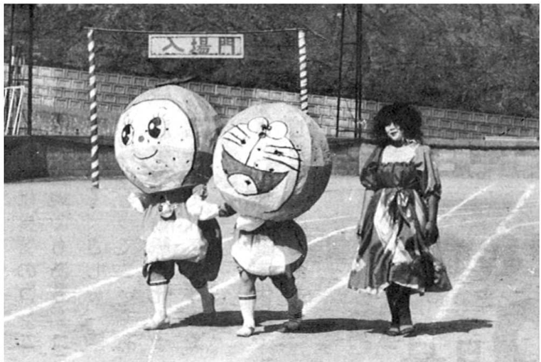
ドラえもん・ドラミちゃんも登場