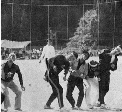
手をつかってはいけません