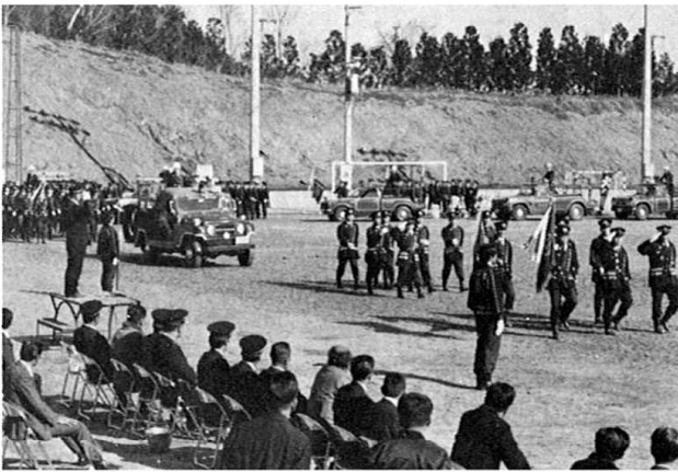
きびきびとした分列行進