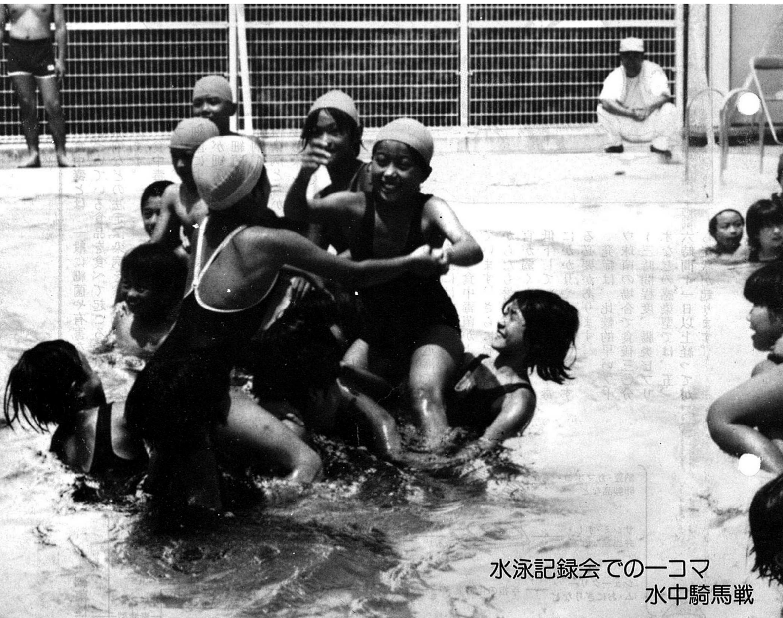
水泳記録会での一コマ 水中騎馬戦