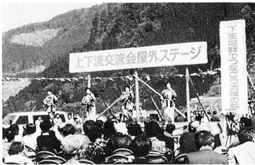
地元婦人会の踊りにも熱が入ります

今後、私たちの生活に不可欠な「水」を確保することとは、私たち水源地域に住む住民の責務ではないでしょうか。それが中津江村の活性化の一助となるのではと思います。