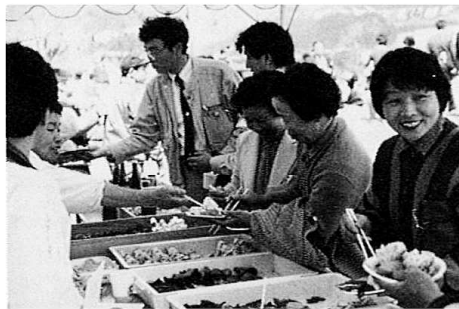
「おにぎり、山菜もおいしいわね」 バザー会場にて