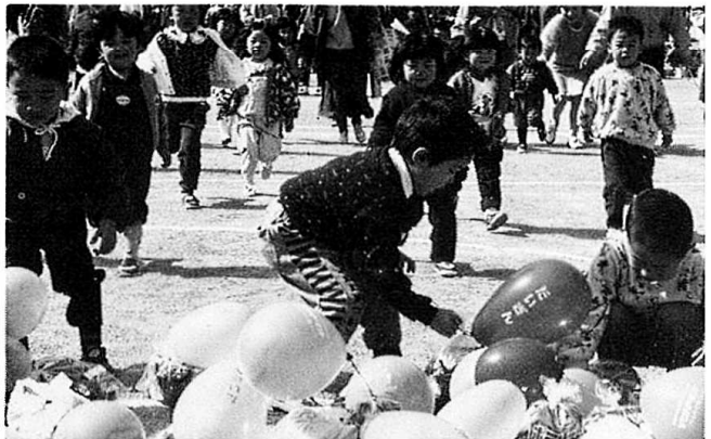
どれがいいかこまっちゃうな～幼児のお菓子ひろいより