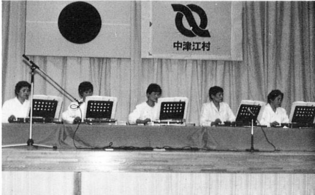
息もピッタリ～大正琴の熱演

練習時間の確保など、出演者の方々も大変なご苦労があるとは思いますが、今後ともご精進ください。また、ようお願いしますと共に、ご協力くださいました方々からお礼を申し上げます。