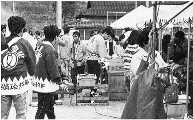
グルメの秋～バザー会場より