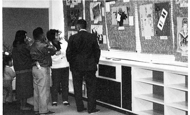
児童・生徒作品展(図画)の前で