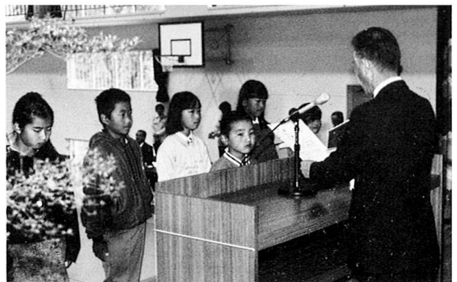
よくがんばったね～児童・生徒作品展入賞者