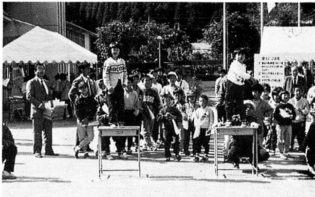
うまく飛ばないなあ～小学生の紙ひこうき飛ばしより