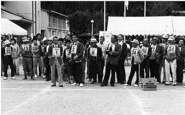
タイミングがむつかしいなあ～長ぐつ投げNo.1より