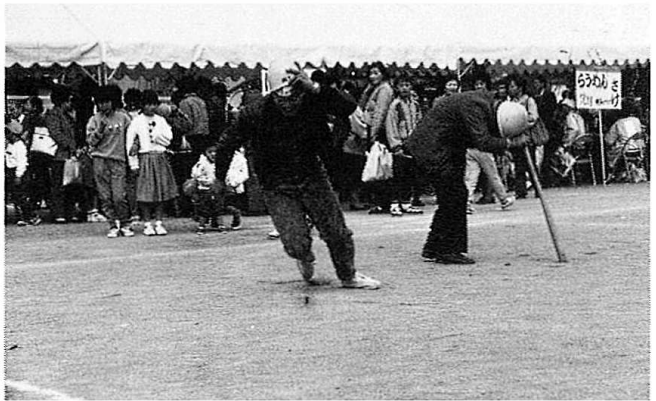
足元フラフラなんです～宇宙遊泳より