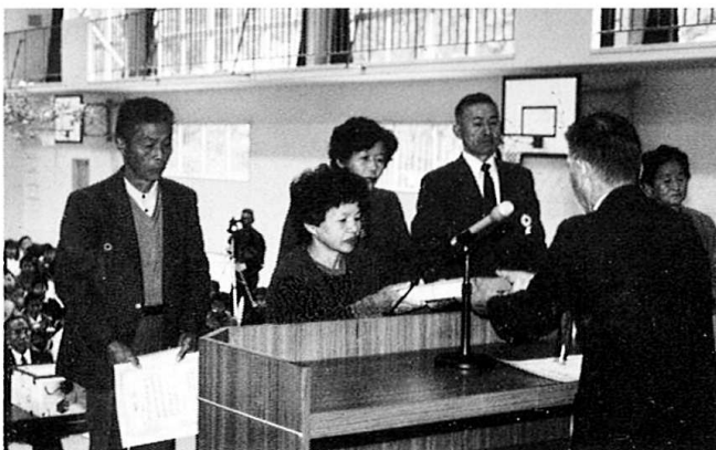
おめでとうございます～農林産物品評会入賞者