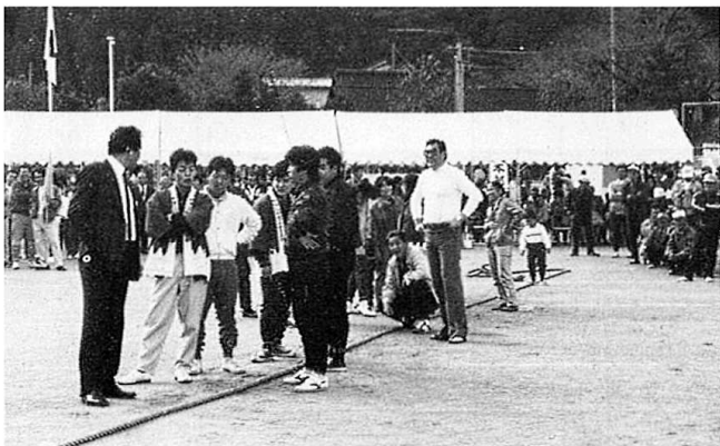
う～ん、もう一度引いて決めよう～綱引きより