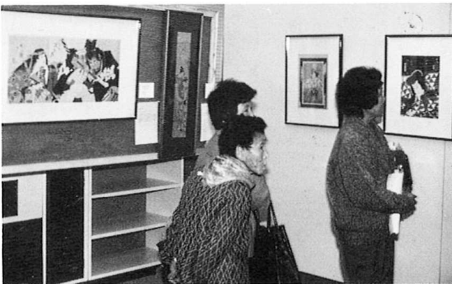
大作の前で～芸術会館移動作品展