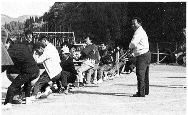
負けるながんばれ～綱引きより