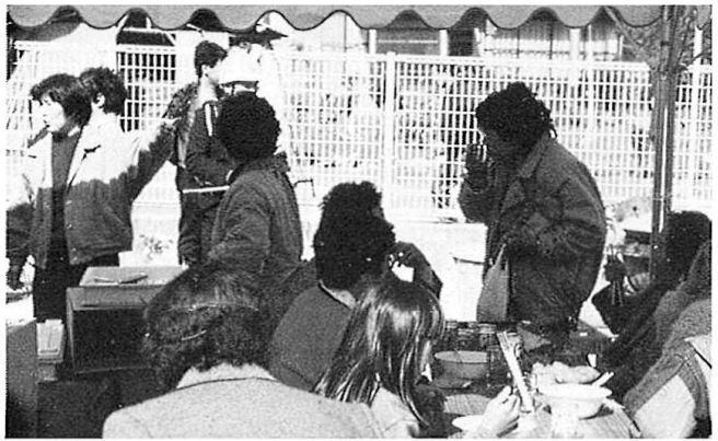
フォーカスされました～バザー会場より