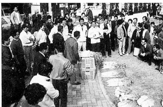
▶さて、いくらか産物の競い

出品された産物は、当日会場で競売され、一品一品競りおとされる度に、大変な歓声があがっていました。来年の品評会では、たくさんさんの産物を出品してくださいませようお願いします。今から、来年の品評会が楽しみです。