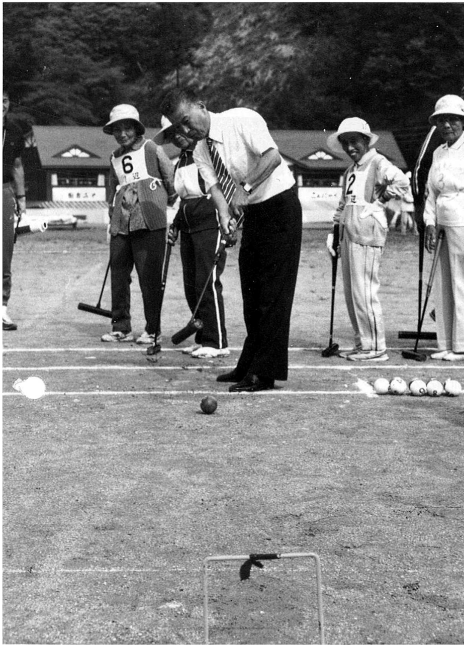
昨年のゲートボール大会での始球式