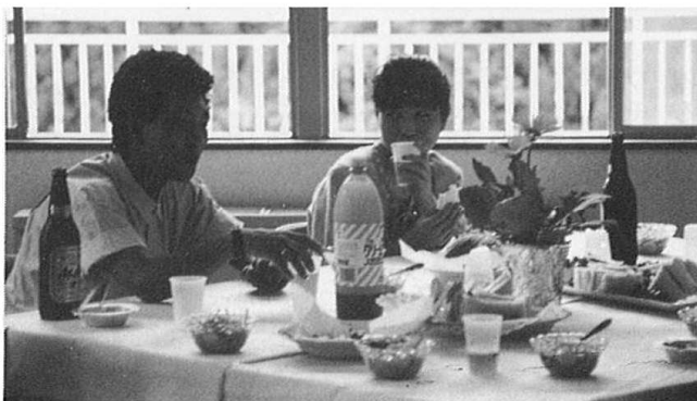
元気だった？ うんまあね