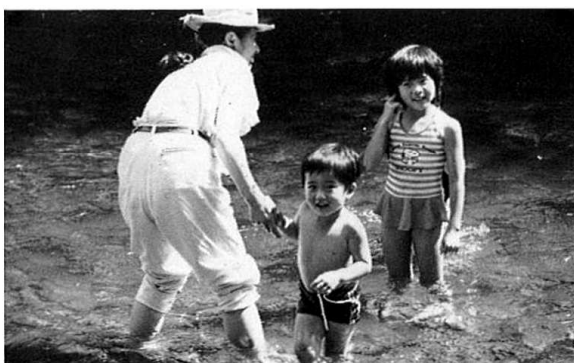
水がつめたいなあ〜川遊び