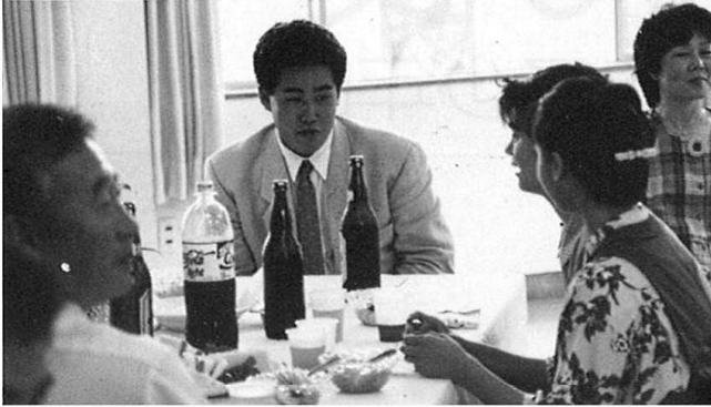
少し、太ったんじゃない