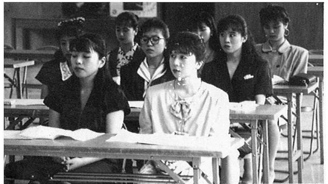
成人式典での女性新成人