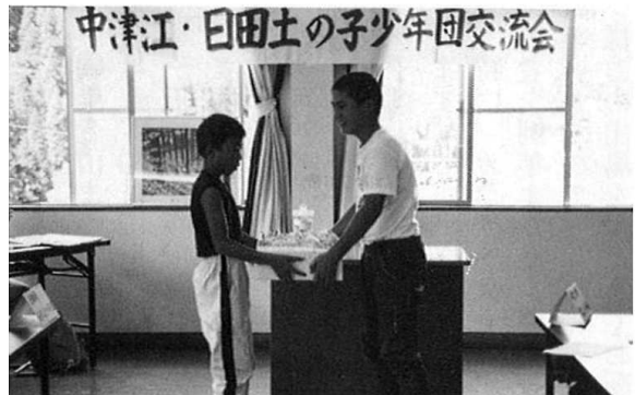
日田市からの記念品の贈呈