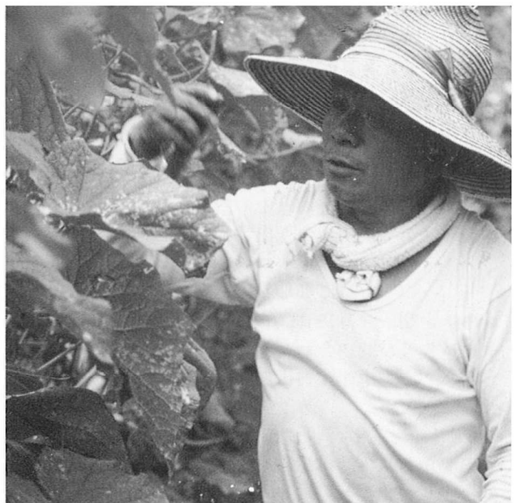
収穫に忙しい清水部会長