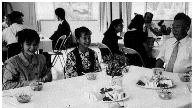
成人祝賀会でホッ！