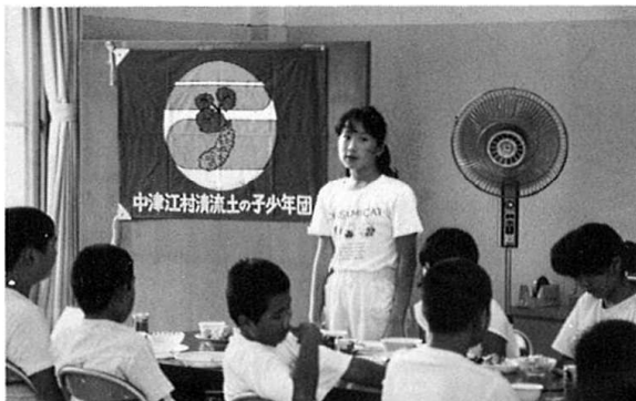
両団員の自己紹介