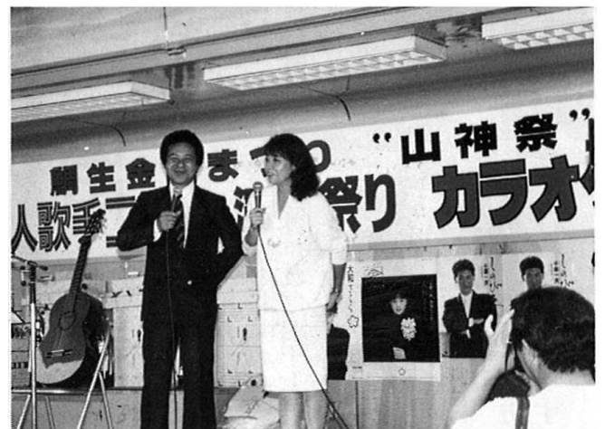
歌謡まつりのおふたり