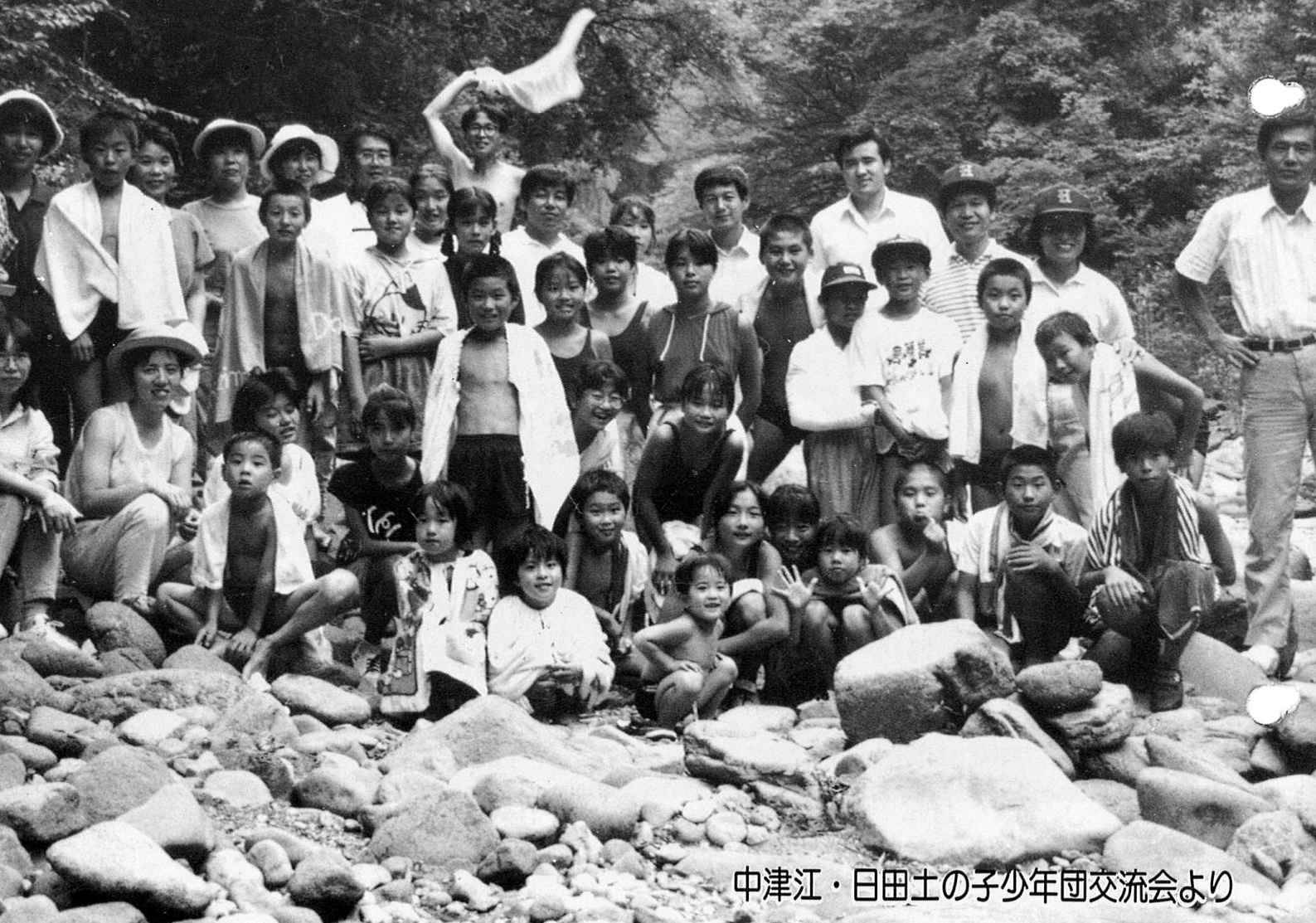
中津江・日田土の子少年団交流会より