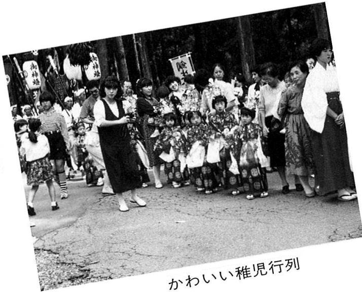
かわいい稚児行列