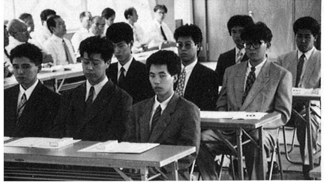
成人式典での男性新成人