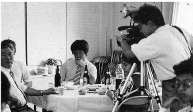
カメラを意識しすぎかな