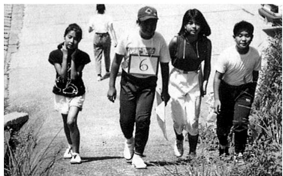
オリエンテーリングでふれあい