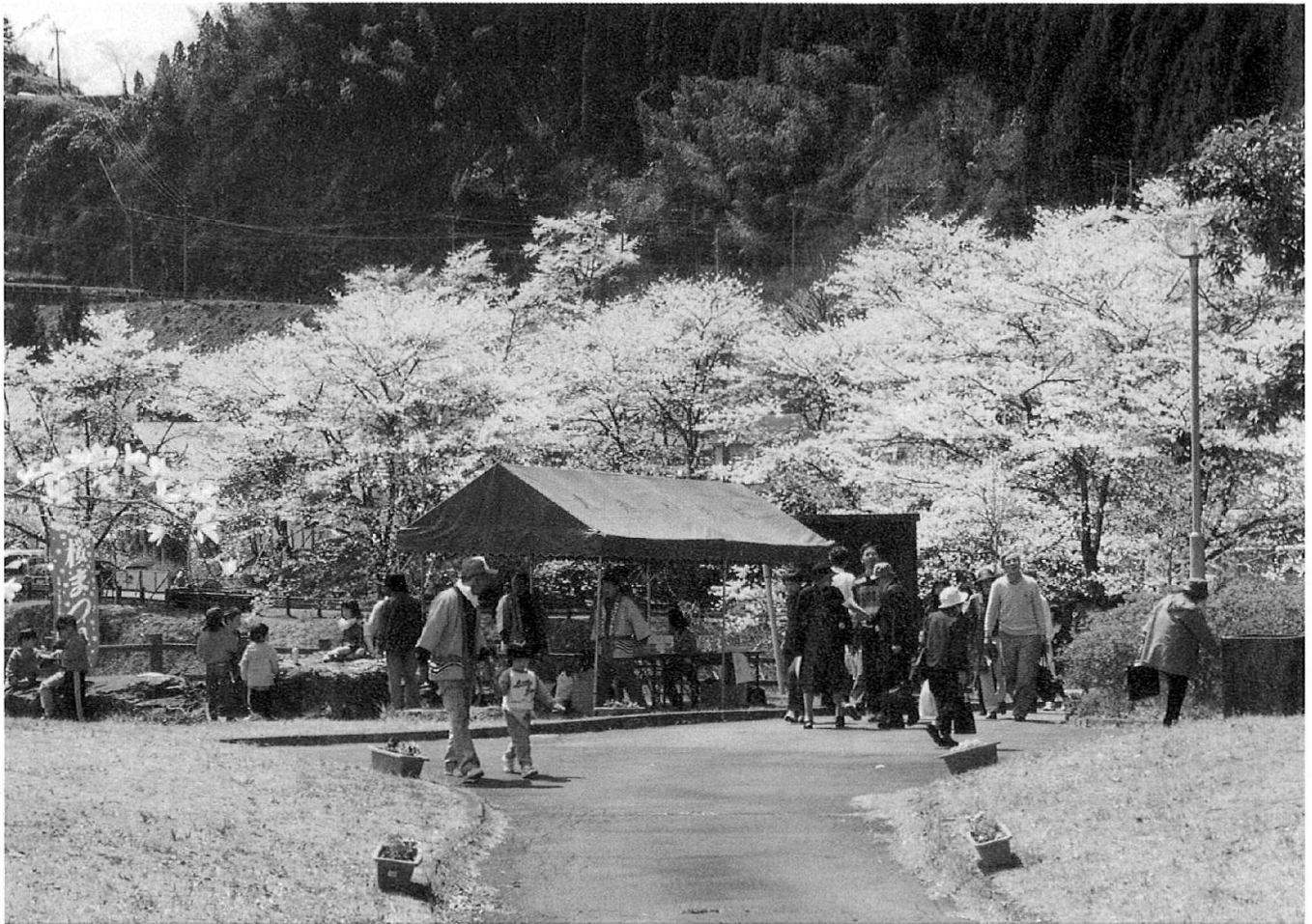
4月9日・蜂の巣湖桜まつりより