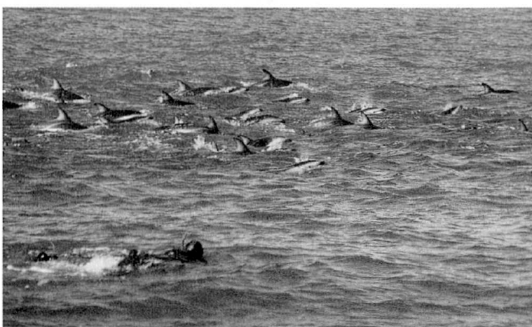
海の中に入り一緒に泳ぐこともできます

をしようといういろいろやっているうちに、何が言いたいのか大体わかってきたのでよかったです。そして買物も楽しかったです。それが何なのかわからないものもあり、感で買ったものもありませんが、日本では売っていないものもたくさん買えて、とても楽しかったです。そして、また行きたいなあーと思いました。