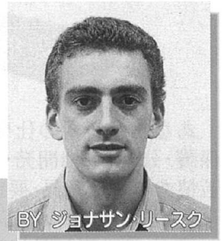
BY ジョナサン・リースク