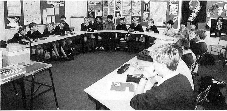
ラスキールカレッジで 日本語の授業に参加