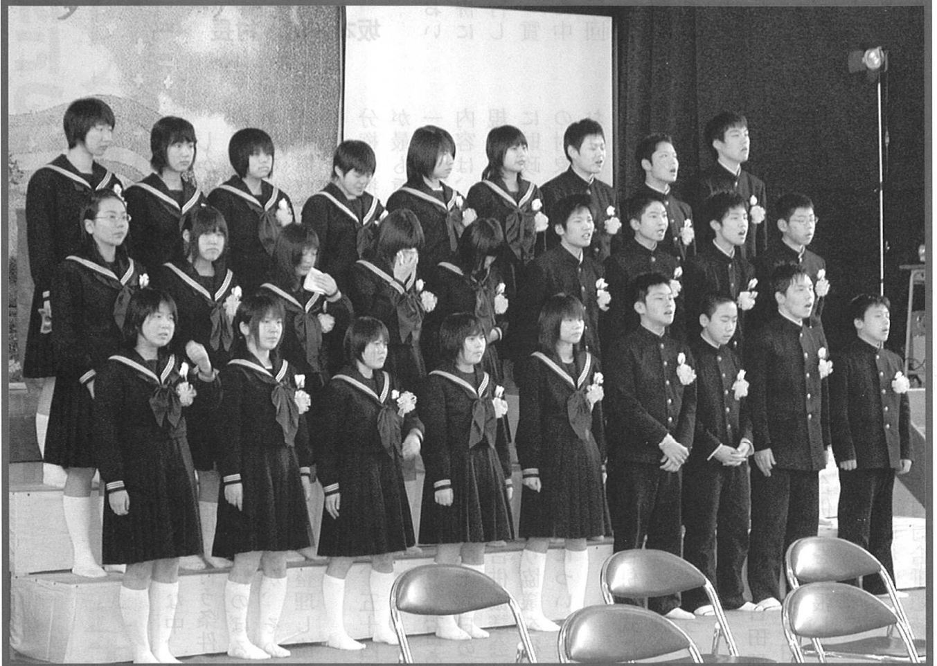
平成 15 年度 津江中学校卒業式 3月5日(金)平成15年度津江中学校卒業式が行われ、卒業する27名一人一人に卒業証書が手渡されました。 卒業されたみなさん津江中学校3年間での思い出を忘れず、これからも頑張ってください。