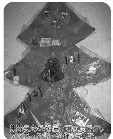
集めたものを使って家族でクリスマス・ツリーを作りました。

教会が済んでから、集まった家族とクリスマスのご馳走を食べ(過ぎ)ます!! 晴れたら(ニュージーランドのクリスマスは夏なので)外でピクニックの気持ちでゆっくりします。食事は半分イギリスの伝統的なメニューと夏スタイルのサラダとデザートです。午後はゆっくりするだけで、クリケットをしたり子どもと遊んだりします。