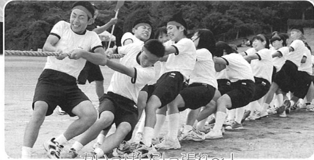
ガイッはい引っ張れ～！