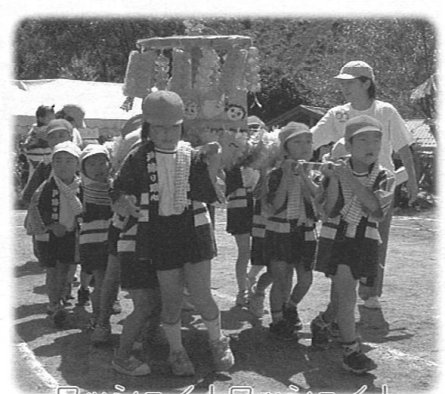
ワッショイ！ワッショイ！