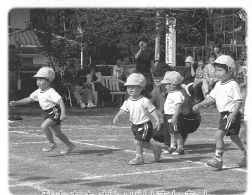
私たちがガンバりました！