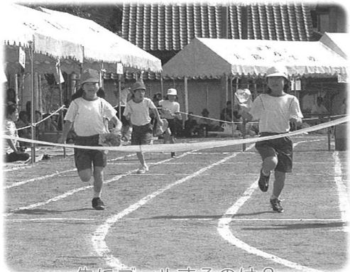
先にゴールするのは？