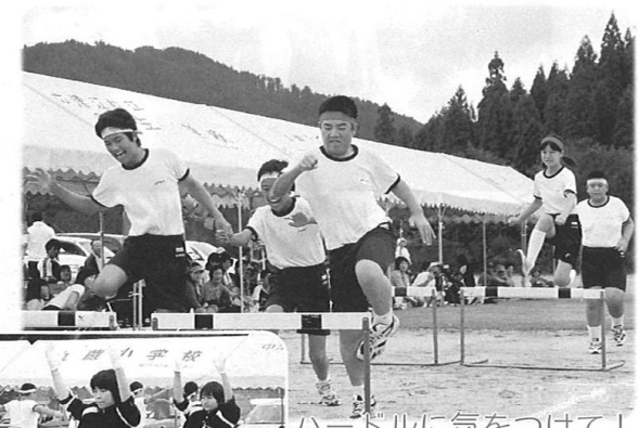
ハードルに気をつけて！