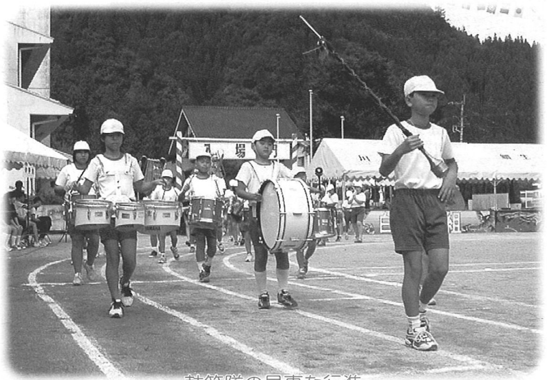
鼓笛隊の見事な行進