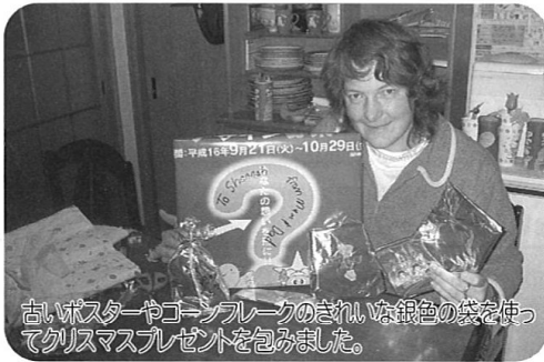
古いポスターやゴーンブルーのきれいな銀色の袋を使ってクリスマスプレゼントを包みました。

クリスマスの4回前の日曜日からは、アドベント・シーズンと言ってイエス様のお生まれが予言されたこととクリスマス・ストーリーを祝う時期となっています。クリスマスの伝統や習慣はクリスマス・ストーリーに基づいているので、簡単に説明しましょう。