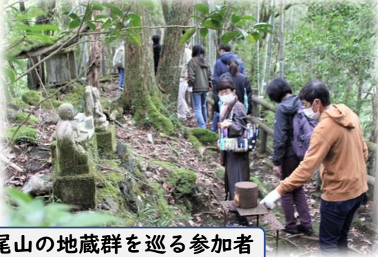
蛇尾山の地蔵群を巡る参加者

第一弾として実施した1回目は、栃野地区の5か所を厳選。ツアー後はコラボ企画として「つどう部会」が開催する月いちバザールで食事や買い物も楽しんでもらいました。今後は第一弾の反省も踏まえて、他の隠れた名所を巡るツアーの継続を考えながら、域外の人を呼べる観光ツアー「中津江小さな旅」の事業化を検討していきます。次回は、あなたも是非ご参加ください!!