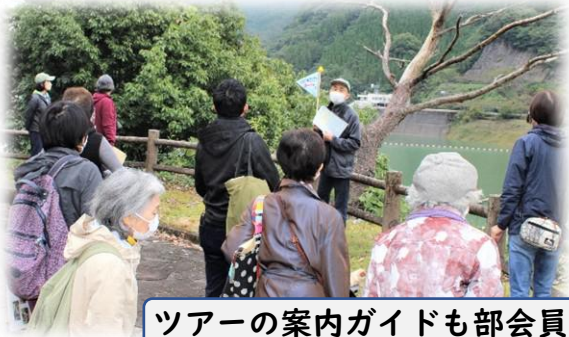
ツアーの案内ガイドも部会員で