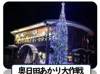
奥日田あかり大作戦