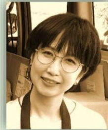
きさらぎ あけみ 如月 朱実 (佐藤 栄希子)